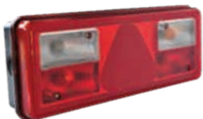
TM10 Hybrid Heckleuchte 24V mit SIMAC Positionslight als LED